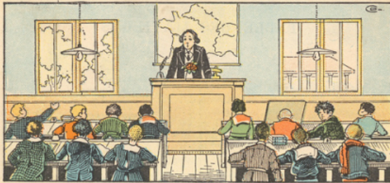
Ma salle de classe.

1. Ma salle de classe est grande, claire et gaie. J'ai plaisir à la retrouver après les grandes vacances. Le long des murs courent des frises qui racontent de belles histoires. Derrière le bureau du maître, au-dessous du crucifix, une carte de France est suspendue.