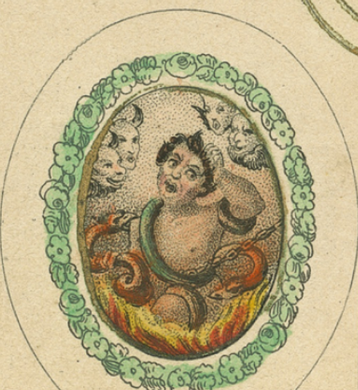
L'Ame en enfer.