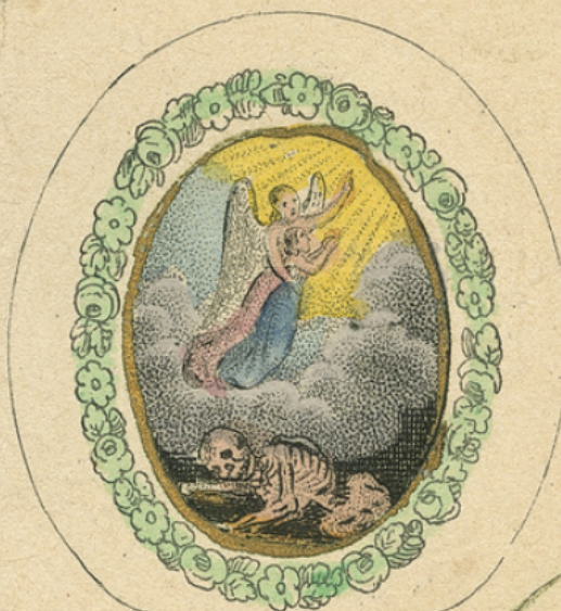
L'Ame quitte le corps.