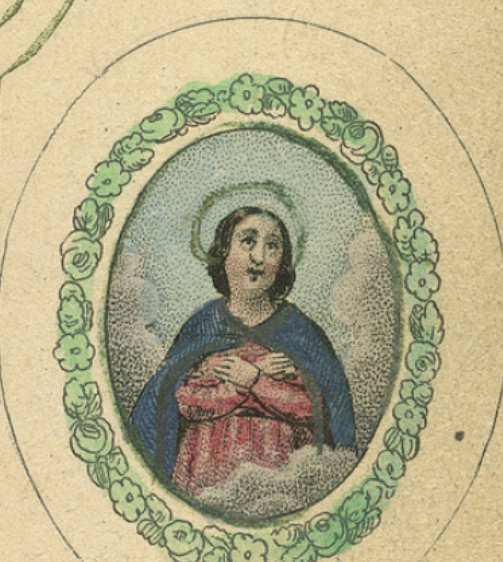
L'Ame en Paradis.