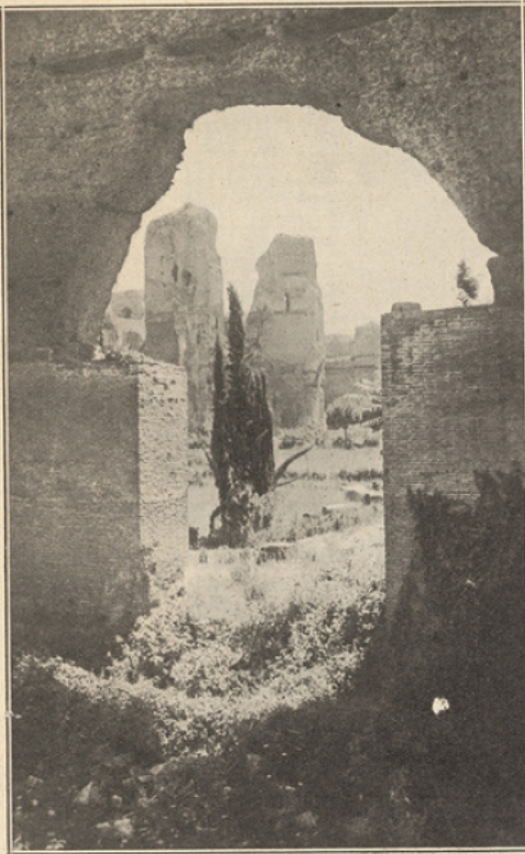
Les Thermes de Caracalla.