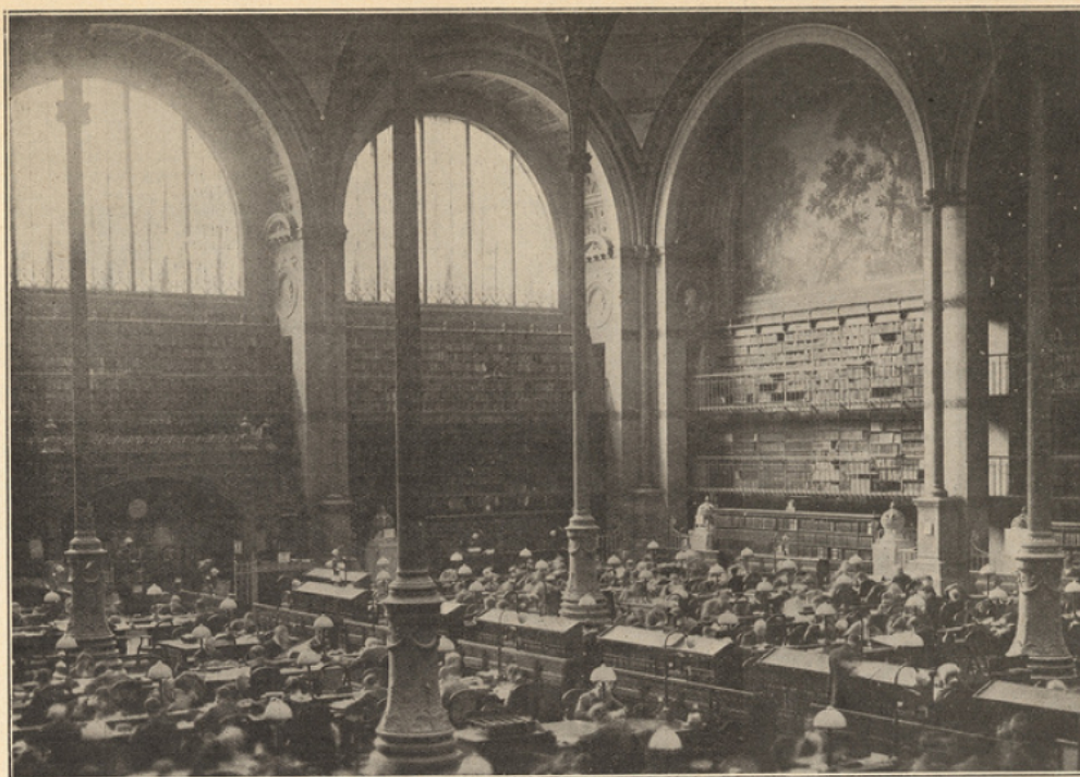
Salle de lecture des Imprimés de la Bibliothèque Nationale.