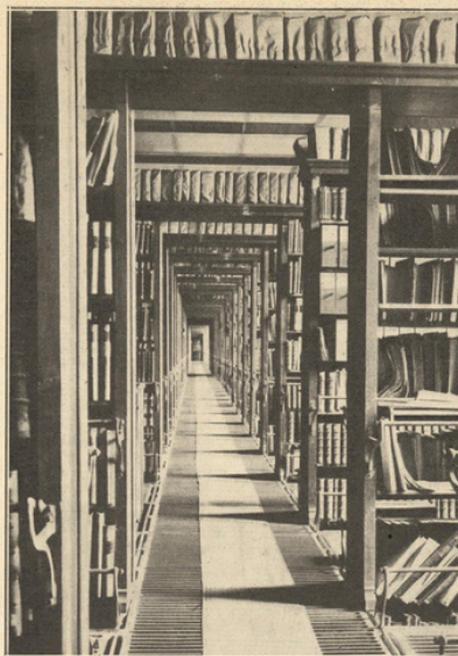
Perspective d'une galerie des combles (150 m. de long). Ces galeries s'étendent sur plusieurs étages tout autour de la Bibliothèque, pour aboutir aux deux grands magasins centraux.

Comme je félicitais sans réserve le nouvel admi-