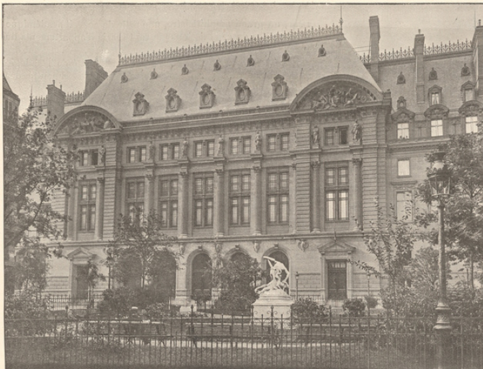
Façade de la nouvelle Sorbonne, sur la rue des Écoles.