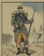
Infanterie française perd 7