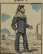
Quartier-Maître ne gagne rien