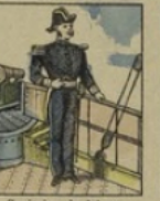
Capitaine de frégate perd 15