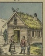
Isbah perd 100