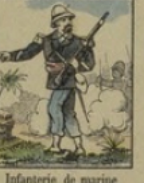
Infanterie de marine perd 120