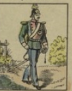
Gendarme russe perd 20