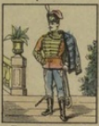
Hussard de la Garde gagne 7