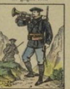
Chasseur alpin gagne 3