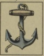
Ancre ne gagne rien