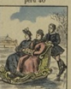
L'hiver sur la Néva gagne 15