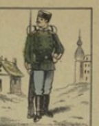
Infanterie russe gagne 70