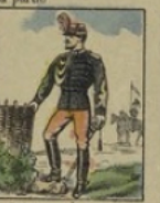
Officier d'État-Major perd 25