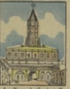
La Tour de Soukareff perd 35