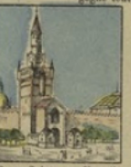
Porte Sainte au Kremlin perd 8