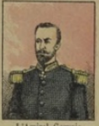
L'Amiral Gervais gagne 100