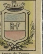
Armes de France gagnent 1