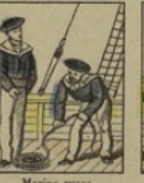
Marine russe perd 90