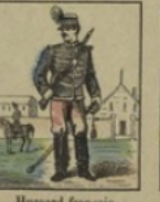
Hussard français perd 10