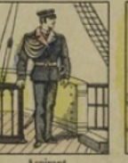
Aspirant perd 90