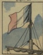
Pavillon gagne 2