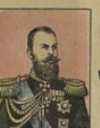
Le Tzar Alexandre III gagne 200