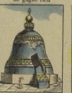
La Reine des Cloches à Moscou, perd 150