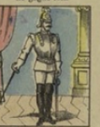
Chevalier-Garde perd 200