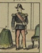
Général français gagne 80