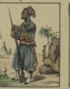
Tirailleur algérien gagne 120