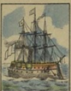
Cuirassé Le Marengo perd 1