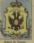
Armes de Russie gagnent 10