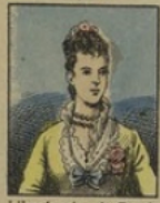
L'Impératrice de Russie gagne 60