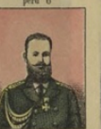
L'amiral G e -Duc Alexis gagne 8