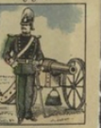
Artillerie russe perd 10