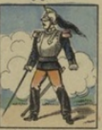
Cuirassier français perd 40