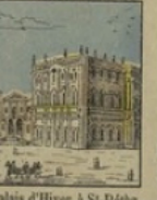
Palais d'Hiver à St-Pétersbourg perd 70