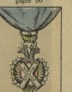
Croix de Saint-André perd 6