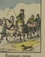
Équipage russe ne gagne rien