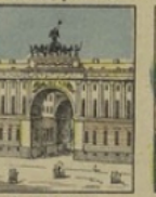
Arc-de-Triomphe à St-Pétersbourg gagne 6