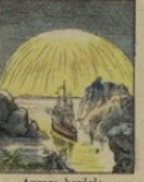
Aurore boréale perd 80