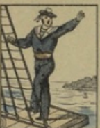
Marin français perd 5