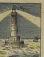
Phare ne gagne rien