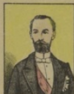
Le Président Carnot gagne 20