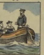
Canot gagne 100