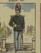
Dragon russe perd 9