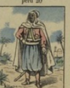
Spahi algérien perd 2