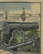
Pièce de marine gagne 5