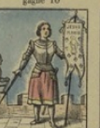
Jeanne d'Arc gagne 90