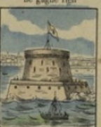
Fort à Cronstadt perd 10