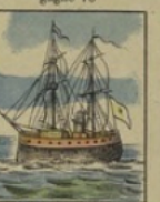
Yacht impérial russe ne gagne rien