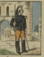
Dragon français ne gagne rien