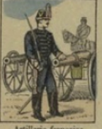
Artillerie française gagne 15