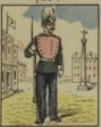
Grenadier de la Garde perd 3