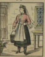
Femme russe gagne 9