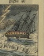
La Tempête gagne 50