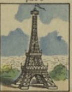
La Tour Eiffel gagne 30