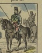
Cosaque du Don ne gagne rien