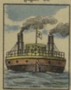
Monitor russe gagne 150