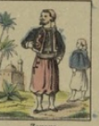
Zouave gagne 35