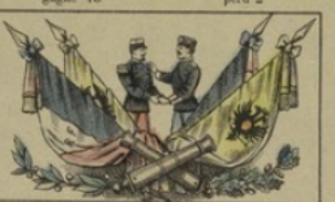
FRANCE & RUSSIE gagne toute la partie