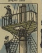
La Hune perd 60