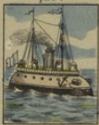
Torpilleur perd 50