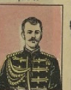
Le Tsarévitch Nicolas gagne 40