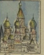
Église au Kremlin ne gagne rien