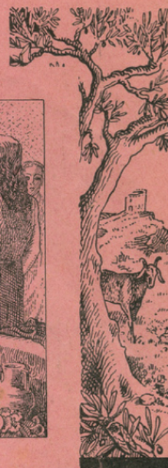
LA FONDATION DE MARSEILLE

AVIS. — Les élèves doivent arriver quelques minutes avant les heures d'entrée parfaitement propres et munis de tout ce qui leur sera nécessaire pendant la classe.