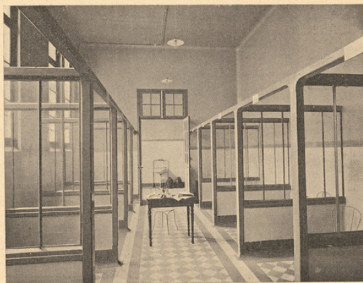
Les boxes des contagieux, à la consultation.

La salle d'autopsie contient trois tables fixes, des lavabos avec eau chaude et eau froide, une série de cuves pour