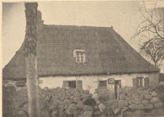
Une vieille école de campagne, à Doux-Albat.

plain-pied dans le bonheur. La Crèche est une école idéale, construite avec une grande et riante simplicité; avec ce seul luxe de la fraîcheur de la peinture et de la clarté des murs qu'excelle depuis peu à chanter l'âme, redevenue naïve, du maître de La Curée . Au reste, c'est surtout dans la cour qu'il montre, qu'il voit les écoliers, enfances ardentes à la joie, saines et rosées, composant de leurs ébats les plus florissantes tableaux. Les fêtes pastorales se multiplient, traînant dans la