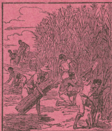
LA CANNE A SUCRE