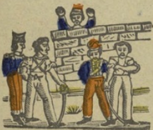
Duel D Duel. Da de di do du.