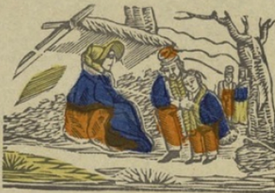
Bivak B Bivouac. Ba be bi bo bu.