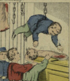
Pour le punir, le garçon boucher accroche à son étal par le fond de son pantalon, et tous les petits garçons du quartier viennent se moquer de lui.