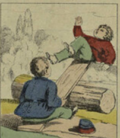
Au jeu de bascule, il envoyait toujours les autres en l'air, les tenant longtemps suspendus pour leur causer des frayeurs.