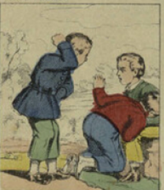
Quand on jouait à la main chaude, il tapait si fort qu'il démantibulait dos et bras à ses camarades.