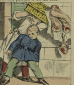
N'ayant pas voulu se ranger dans la rue, il fait trébucher un garçon boucher et tomber sa marchandise.