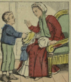
Sa maman l'avait prié de lui donner son chapeau; mais il le prend brutalement, et voyez dans quel état il l'apporte.