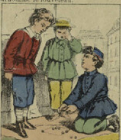
Il avait une manière à lui de jouer aux billes: il empêchait toutes celles de la partie, qu'il eût gagné ou non.