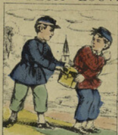
Quand le déjeuner de ses camarades lui plaisait, c'était à coup de poings qu'il en réclamait une part.