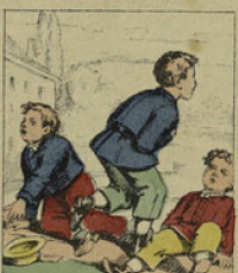
Quand il jouait aux barres, il renversait tout sur son passage comme ferait un sanglier dans un bois.