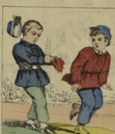
S'il attrapait un de ses condisciples par les pans de sa tunique, vous étiez sûr que les morceaux lui restaient dans les mains.