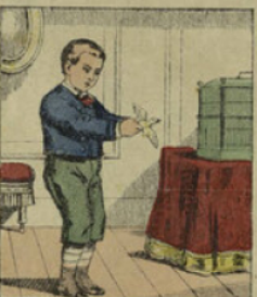
Il saisit si fort le serin qui s'était échappé de sa cage que le pauvre oiseau ne chanta plus jamais; il l'avait étouffé net. O le brutal!