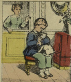
Quand il caressait le chat, il l'étouffait aux trois quarts, tant il s'y prenait brutalement.