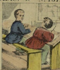
Il trouvait plus commode de forcer les autres à écrire ses devoirs que de les faire lui-même.