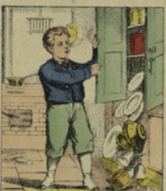
En ouvrant vivement le buffet, il fait tomber un magnifique service en porcelaine auquel sa maman tenait beaucoup.