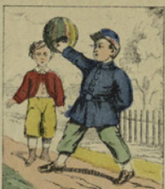
Il renvoyait le ballon avec tant de rudesse qu'il le crevait toujours. Voyez!