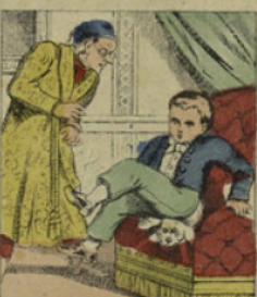
En se jetant brusquement sur un fautouil, il écrase le vieil épagneul de son grand papa. Le pauvre animal mourut sur-le-champ!