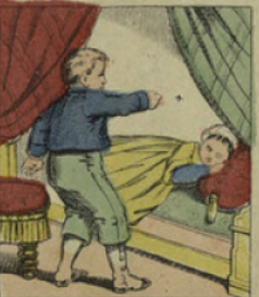
En voulant chasser une mouche qui troublait le sommeil de sa petite sœur, le brutal tape si fort qu'il fait une fosse au front de la pauvre enfant.