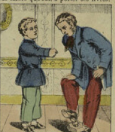
En voulant faire parade de sa force devant son parrain, il lui laisse tomber un poids fort lourd sur le pied, justement son parrain avait un cors!