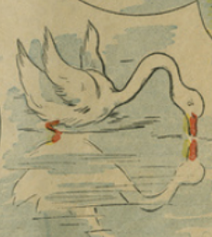
11. Il s'éleva dans l'eau et nagea pour les rejoindre. Mais que vit-il dans l'eau transparente ? son image. Ce n'était plus un oiseau mal fait, vilain et dégoûtant ; il était lui-même un cygne.