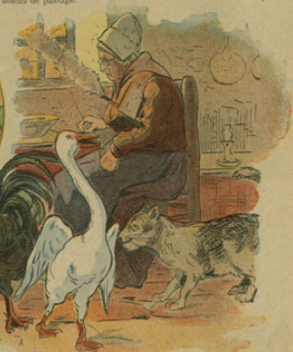
6. Là, il vit une vieille femme avec un énorme matou et un coq. Comme elle était très myope, elle le recueillit et le prit pour une grosse cane égarée ; mais le chat et le coq lui montrèrent tant de jalousie, qu'il reprit son vol et s'en alla nager dans une mare voisine.