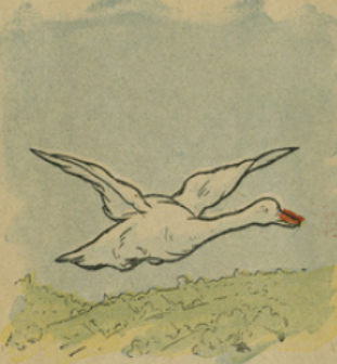
2. Le pauvre canet, se sentant la risée de toute la basse-cour, avait tant de chagrin de sa laideur, qu'un jour il prit son vol.