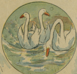
10. Il serait trop triste de raconter toute sa misère et les souffrances qu'il eut à supporter pendant l'hiver. Un jour de printemps, il se trouva dans un grand jardin quand, des profondeurs du bois, sortirent trois cygnes blancs et magnifiques.