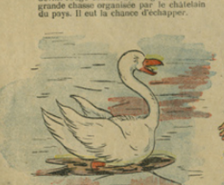
7. Et l'hiver devint bien froid, l'eau gelait de jour en jour et, chaque nuit, le trou dans lequel il nageait se rétrécissait davantage ; il était obligé d'agiter continuellement ses jambes pour que le trou ne se fermât pas. Il se sentit bientôt épuisé et fut saisi par la glace.