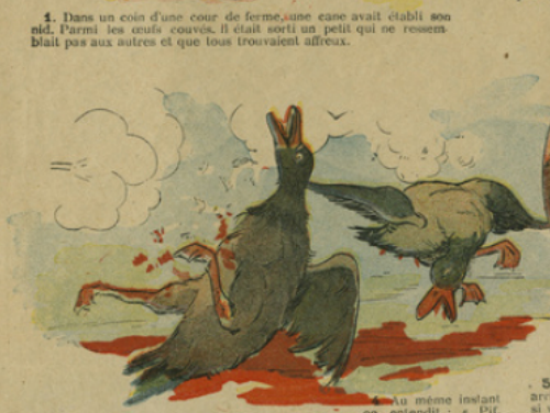
4. Au même instant on entendit : « Pif-paf ! » Deux canards qui l'accompagnaient devinrent rouges comme du sang. C'était une grande chasse organisée par le châtelain du pays. Il eut la chance d'échapper.