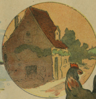
5. En se sauvant, sur le soir, il arriva à une misérable chaumière, si vieille et si ruinée qu'il ne savait de quel côté tomber ; aussi restait-elle debout.