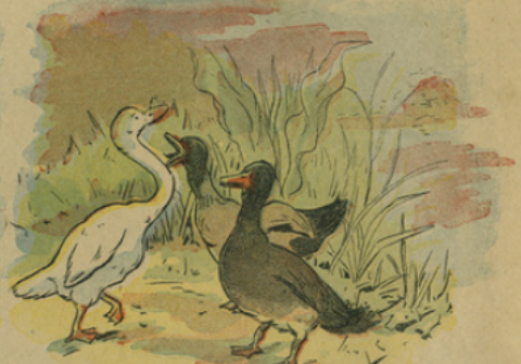
3. Il arriva dans un grand marécage qu'habitait des canards sauvages qui lui proposèrent de vivre avec eux et de devenir un oiseau de passage.