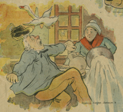
9. Là, il revint à la vie, mais effrayé du milieu où il se trouvait, persuadé qu'on allait lui faire du mal, il se jeta de peur au milieu du pot au lait, renversa de nombreux ustensiles de cuisine et reprit sa liberté.