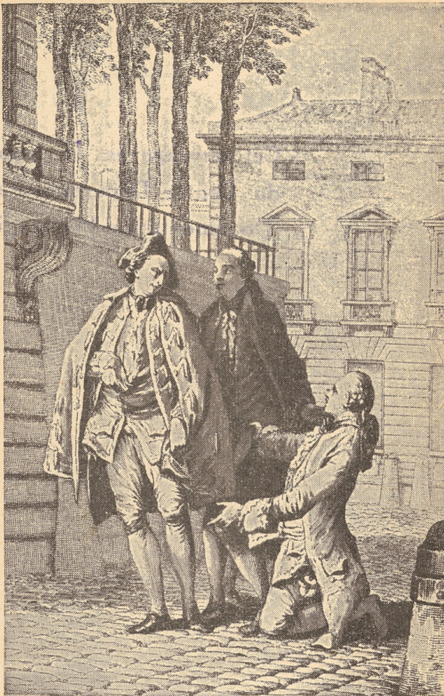
Dessin de J.-M. Moreau le Jeune pour l'édition du Théâtre de Molière ; Paris, 1773.

SCAPIN. Monsieur, que vous ai-je fait ? LES FOURBERIES DE SCAPIN , ACTE II, scène III.