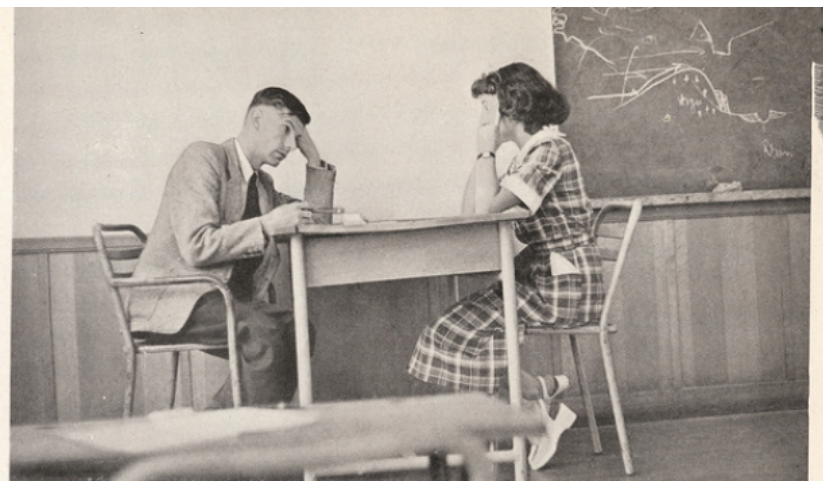
HISTOIRE ET GÉOGRAPHIE (ci-dessus). L'examineur est sévère. Les questions : l'esclavage aux États-Unis, les Vosges et les fleuves de l'A. O. F. Réponses moyennes.

On reproche aussi à notre enseignement secondaire d'être trop encombré d'élèves. Mais là encore il s'agit de savoir d'abord où l'on va. S'il est destiné à former des spécialistes de la dissertation théorique, on ne voit pas en effet ce que viendraient y faire 750.000 enfants de tous âges. Mais s'il s'agissait de former des hommes,