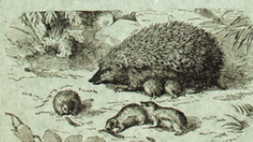
division et ses petits

gré. S'il est attaqué, il se roule en rachant sa tête entre ses pattes et redressant ses piquants ; il a alors l'aspect d'une longue toile « hérissée » de pointes, et il ne serait pas facile de le saisir. Cet animal ne mange jamais de fruits, ne rouge aucune racine ; il ne vit que d'insectes et de bêtes minuscules : hannetons, larves vracées, papilles ; il détruit les vipères, qui le croque avidement, sans souci de leur morsure. Il faut donc se garder de détruire ces utiles animaux, qui protègent nos récoltes et même notre vie. C. DELON.