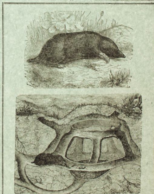
LA TAUPE ET SON NID.