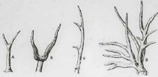
Bois de Cerfs; A, du Miocène inférieur; B, du Miocène moyen; C, du Miocène supérieur; D, du Pliocène.