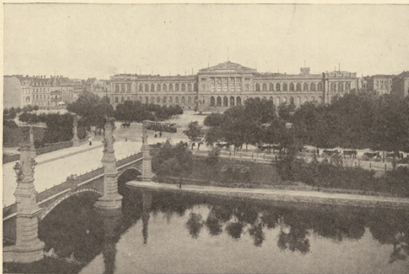
Vue générale de l'Université de Strasbourg, par devant la place de l'Université et l'Ill.