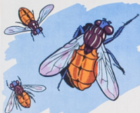
les mou ches

bou che - cou de - moue bou le - gou tte - pou pée