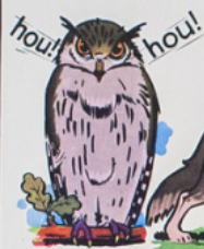
hou! dit le hi bou