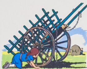
un cha ri ot