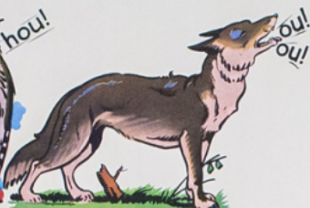
ou! ou! dit le loup