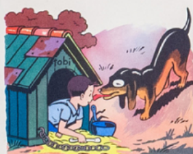
la ni che de to bi