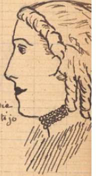
Eugénie de Montijo