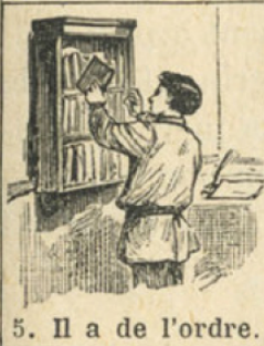
5. Il a de l'ordre.