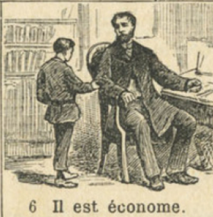
6 Il est économe.