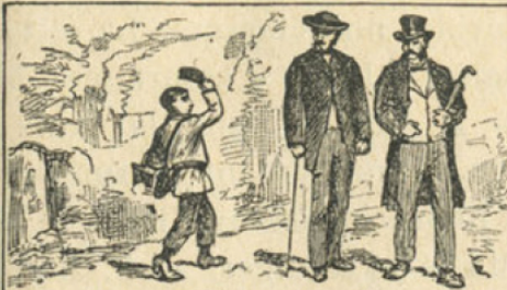
1. Jules est poli.