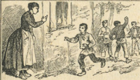
3. Il est obéissant.