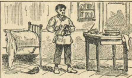
2. Il est propre.