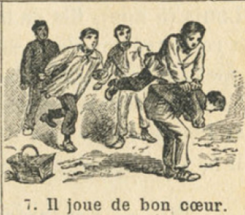
7. Il joue de bon cœur.

RENSEIGNEMENTS. — Comparez ce que fait Jules avec ce que font les enfants qui n'ont pas ses qualités. — L'élève ne dépose que de petites sommes à la caisse d'épargne scolaire; mais cela suffit pour qu'il apprenne l'économie.