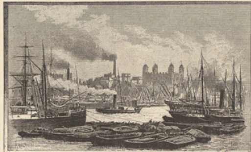
Gravure extraite de l'Angleterre pittoresque.

Les Enlums de Paris, par L. BARRON. Ouvrage orné de 500 gravures et d'une carte. Relié avec fers spéciaux, 37 fr.