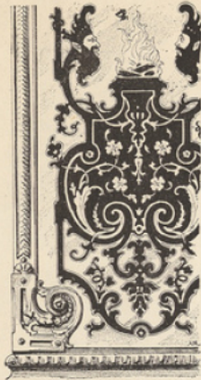
Gravure extraite de la Composition décorative.