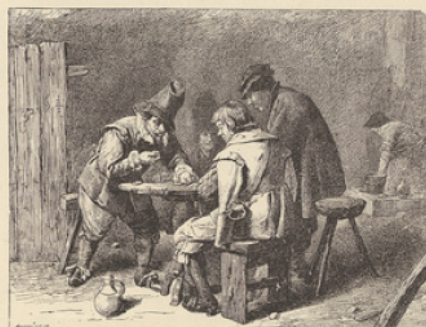
Gravure extraite de la Peinture flamande.

Les Arts du Bois, des Tissus et du Papier. Ouvrage orné de 338 gravures dans le texte. Prix, broché, 40 fr.