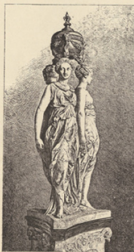
Gravure extraite de la Renaissance en France.

Joaillerie de la Renaissance, d'après des originaux et des dessins du XV e au XVII e siècle, par F. LETHBRUN. Album in-4 e contenant de nombreuses illustrations dans le texte et 20 planches hors texte. Prix, dans un cartonnage artistique, 100 fr.