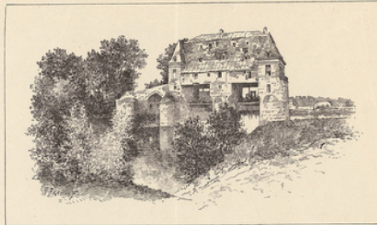
Gravure extraite des Enlums de Paris.