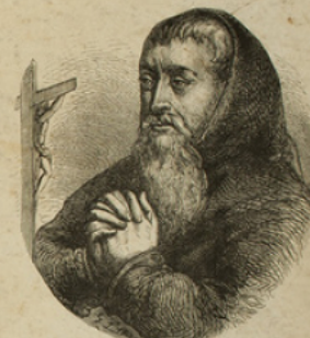
Le Père Joseph.

L'activité de Richelieu n'est pas tout entière employée à l'abaissement des grands, des protestants et de l'aristocratie. Il ramène l'économie dans les finances, seconde le développement du commerce et de la richesse publique, commence à organiser une marine de guerre, enfin favorise les sciences par la création du Jardin des Plantes (1626), et les lettres par la fondation de l'Académie Française (1635).