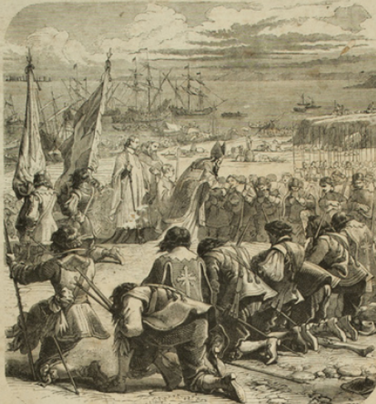
Les Français communient avant de combattre.

Maréchal de France en 1625, Schomberg chassa les Anglais de l'île de Ré, servit avec gloire au siège de la Rochelle, puis dans la guerre contre la Savoie, et mourut en 1632, après avoir vaincu Montmorency.