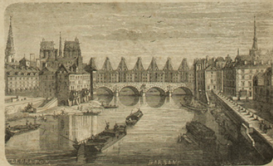
Le Pont Saint-Michel sous Louis XIII.