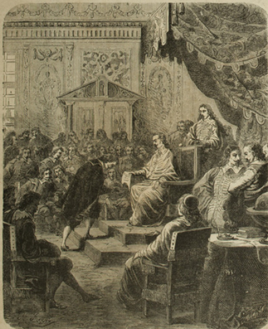
Installation de l'Académie française par Richelieu.

Richelieu avait lui-même une espèce de premier ministre: c'était un espagnol, appelé le père Joseph, et surnommé l'Éminence grise. Très instruit et très habile, le moine rendit de grands services à la France.