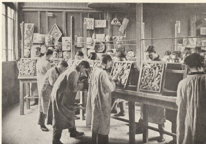
Section du métal. — Cours de modelage.

travaux personnels dont ils ont dessiné entièrement les plans. Leur enseignement théorique, d'autre part, est poussé assez loin. Le programme comporte pour ces élèves « l'analyse détaillée des œuvres des styles français, le dessin à vue d'après des modèles classiques, d'après des meubles ou objets d'art, enfin d'après la flore, la faune ou la figure, le dessin de construction avec plans grandeur nature et devis d'exécution, l'architecture intérieure et la composition décorative appliquée