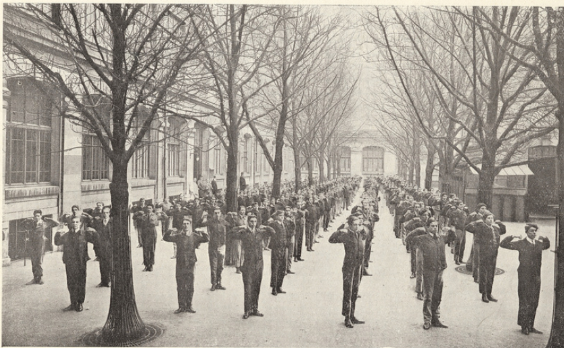
Séance de gymnastique dans la grande cour intérieure.