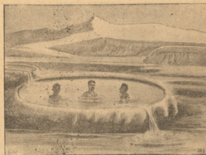
TROIS INDIGÈNES FAISANT LEUR CURE.