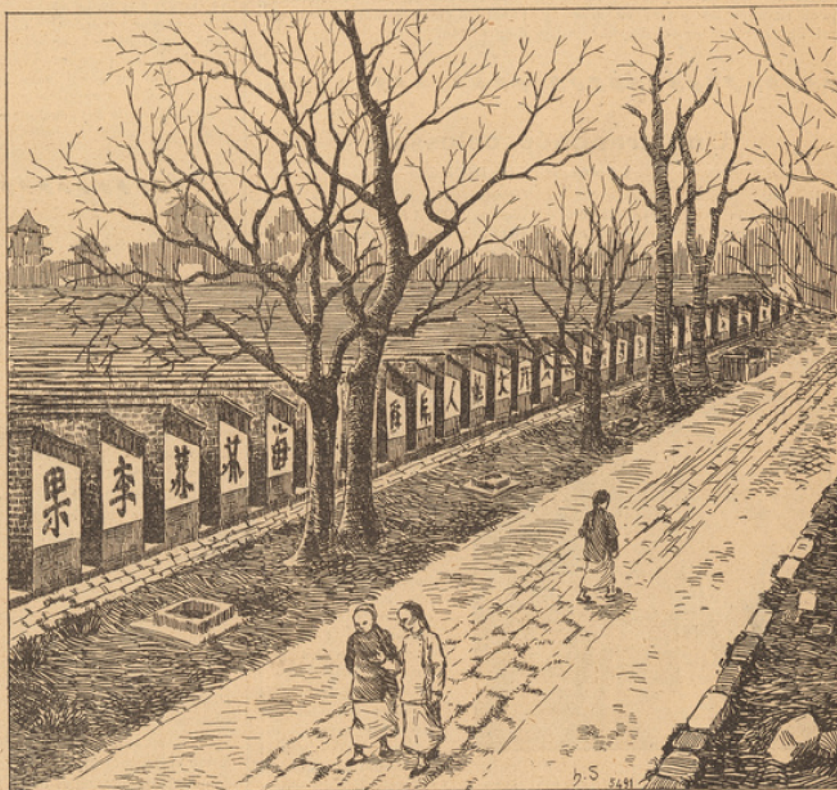
LES CANDIDATS AUX EXAMENS SONT ENFERMÉS DANS CES CELLULES ET PRIVÉS DE TOUTE COMMUNICATION AVEC L'EXTÉRIEUR

concourant pour les grands prix de Rome, ils restent prisonniers, parfois pendant plusieurs jours. On raconte qu'il est arrivé que de malheureux candidats meurent d'épuisement dans leur étroite prison. On est alors obligé de