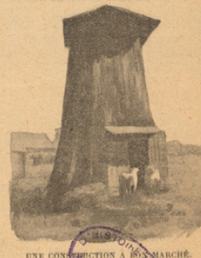
UNE CONSTRUCTION A 150 MÈTRES.

la base, et qui ne mesure pas moins de trois mètres de hauteur.