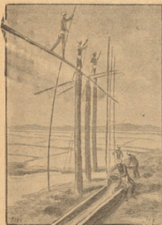
L'ALIMENTATION DES MARAIS SALANTS.

A marée basse, il y a sur la côte de Madras beaucoup de petits lacs assez profonds. Des industries se sont installées là pour l'exploitation du sel marin.