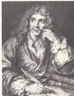
Portrait de Molière.