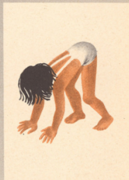
L'âlène et ses amis