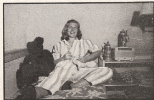
Le soir, la radio retransmet dans les chambres les programmes de jazz.

Demain, j'ai un test en sociologie. J'ai pu enfin choisir cette année les cours qui m'intéressent. J'ai longuement discuté, pendant la Freshman week, avec le professeur qui me sert de conseiller, et nous avons fait ensemble le plan des trois années d'études qui sont encore devant moi. Je dois avoir quinze points de crédit chaque semestre, et chaque cours représente trois points. J'ai donc cinq matières ce semestre, et mon emploi du temps s'arrange de telle sorte que mes cours se passent le matin : sociologie, psychologie élémentaire, histoire des États-Unis, histoire de la philo-