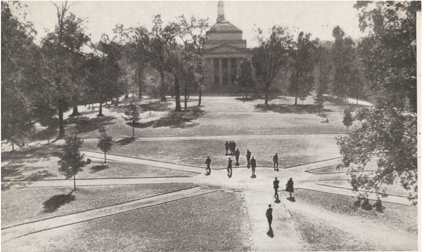
Dix fois par jour les étudiants se croisent sur le campus de l'Université, affairés, d'une classe à un rendez-vous, du gymnase à l'ice cream soda.