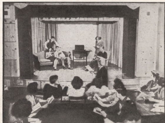
La récompense des bons élèves consiste à faire partie de la troupe théâtrale.

filles et les dorms des garçons, les marches de la bibliothèque sont le rendez-vous habituel des jeunes gens. On se rencontre entre les classes, pour fumer une cigarette, parler du dernier foot-ball game . On discute des classes, des professeurs, de tout. Mais, une fois la porte franchie, c'est le silence total.