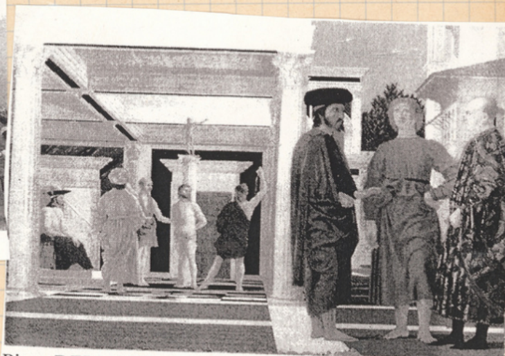
Piero DELLA FRANCESCA, La flagellation, 1454 tempera sur bois