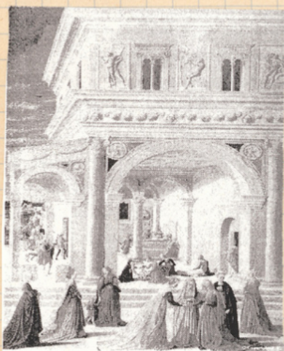
Bartolomé di Giovanni Corradini (Fra Carnevale) Nativité de la vierge, vers 1467, tempera sur bois