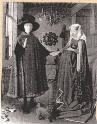
Jan VAN EYCK, les époux Arnolfini, 1434 huile sur bois