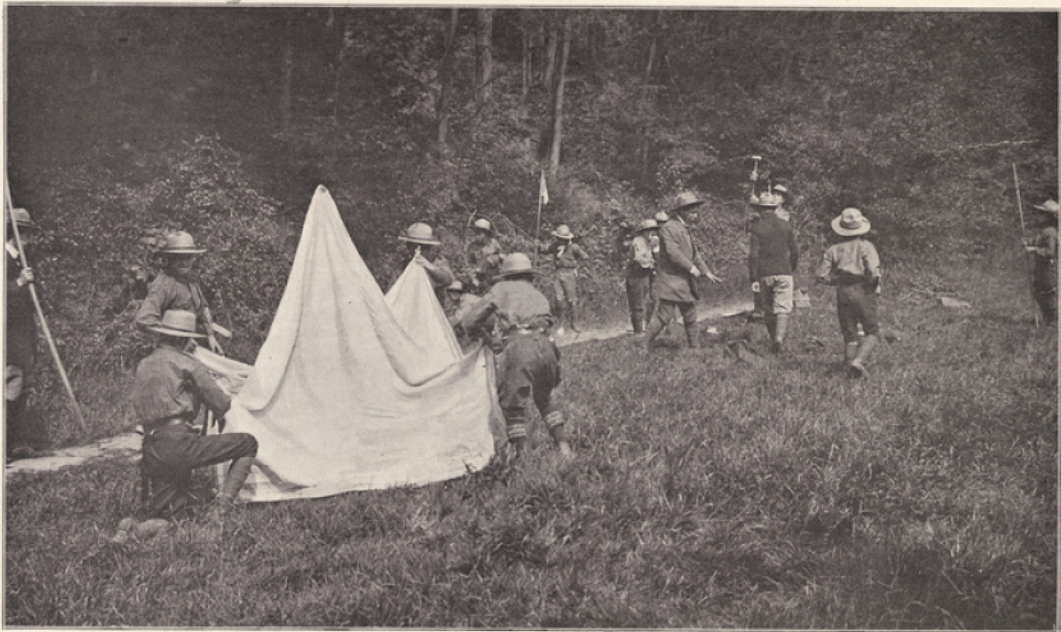
LES ÉLÈVES ÉCLAIREURS. — Sur le terrain de campement, après un exercice topographique: on dresse la tente et on va préparer le repas.

Faire vivre par l'adolescent ce qui l'attire dans les livres d'aventure, orienter ses jeux en en faisant un moyen de discipline morale, l'habituer à vivre en plein air, développer chez les jeunes l'ingéniosité pratique, l'esprit du sacrifice, la gaieté dans l'effort, c'est évidemment et très adroitement apprendre aux enfants à travailler pour eux-mêmes, pour notre race et pour notre pays.