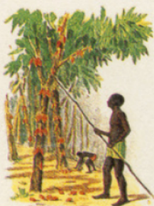
LA RÉCOLTE DU CACAO