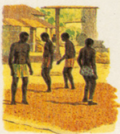
LE SÉCHAGE DU CACAO