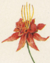
LA FLEUR AGRANDIE 3 FOIS