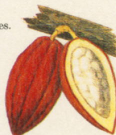
LE FRUIT 1/2 GRANDEUR