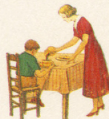
LE PETIT DÉJEUNER