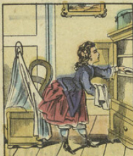
Jeanne range soigneusement dans une petite armoire les effets de la poupée.