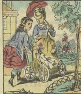
On fait ainsi une promenade dans le jardin.