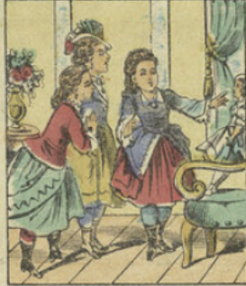
Jeanne amène à la maison ses petites amies, pour leur faire admirer cette belle poupée.