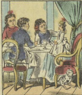
La poupée vient d'être placée à l'un des bouts de la table. — Elle est très sage.