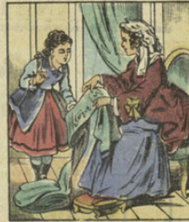
Sa Maman la félicite, et pour la récompenser, lui donne de belles étoffes pour habiller sa poupée.