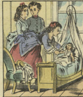
En rentrant à la maison, les petites filles débarrassent la poupée et la mettent au lit.