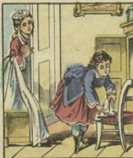
La Maman de Jeanne la regarde à la dérobée, fort surprise de la voir si soignée et si rangée.