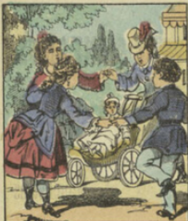
Bientôt on jone en rond, et la poupée est au milieu.