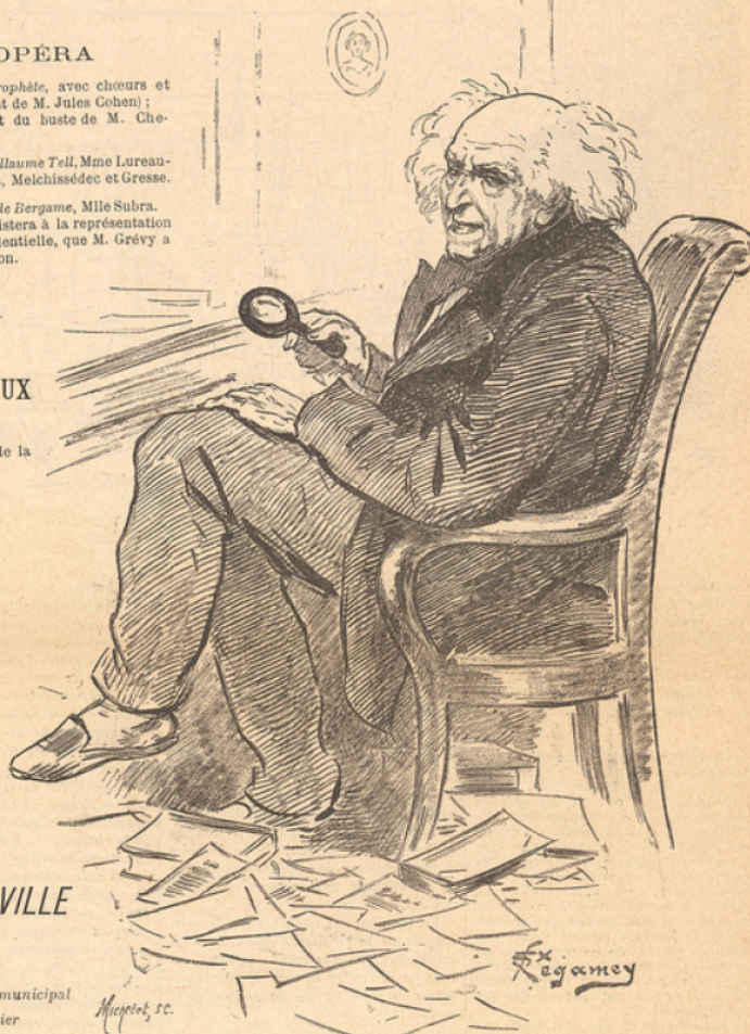
M. CHEVREUL DANS SON CABINET DE TRAVAIL.