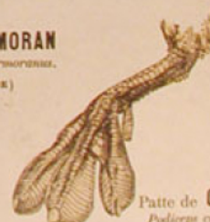
Patte de GRÈBE