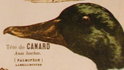
Tête de CANARD

LES PALMIPÈDES ONT LES DOIGTS RÉUNIS PAR DES MEMBRANES QUI LEUR SERVENT À NAGER