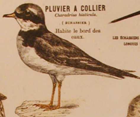
PLUVIER A COLLIER

Granivore qui ne reste chez nous que l'été.