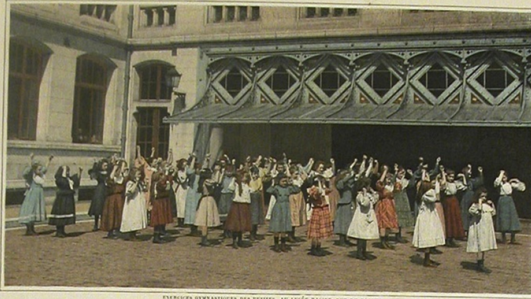
EXERCICES GYMNASTIQUES DES PETITES, AU LYCÉE RACINE, RUE DU RÔCHER.