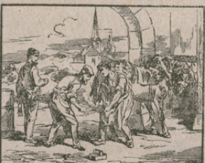
LE MARÉCHAL FERRANT