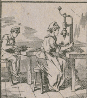
LES AIGUILLES A COUDRE