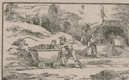
LA MINE DE FER