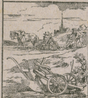
LE SOC DE CHARRUE