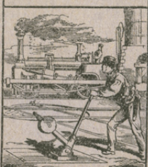
LES CHEMINS DE FER