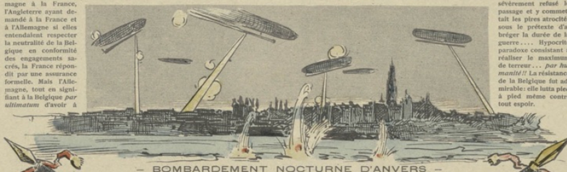
- BOMBARDEMENT NOCTURNE D'ANVERS -

aussitôt ses hordes sur la Belgique qui lui avait sévèrement refusé le passage et y commettait les pires atrocités sous le prétexte d'abréger la durée de la guerre... Hypocrite paradoxe consistant à réaliser le maximum de terreur... par humanité!! La résistance de la Belgique fut admirable: elle lutta pied à pied même contre tout espoir.