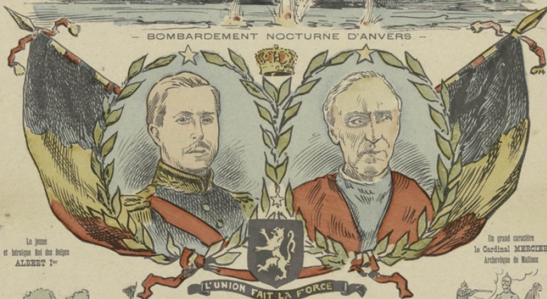
Le jeune et héroïque Roi des Belges ALBERT I er