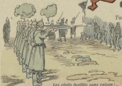
Les civils fusillés sans raison!..

Tous deux Ames de cette magnifique résistance