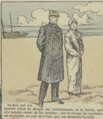
Le Roi, qui n'a jamais cessé de diriger les combattants, et la Reine, qui n'a jamais cessé de les assister: sur le rivage du lambeau de territoire, au sud de l'Yser, qui est demeuré inviolé.