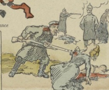
Les femmes assassinées!..