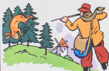
an to nin a tu é ja not la pin