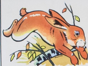
ja not la pin