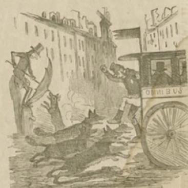
Aspect qu'auront les rues de Paris la semaine prochaine, si le froid continue.

— Facionnaire, surveillez donc mieux que cela!... vous avez laissé prendre tous les bassins des Tuileries... et voilà que votre nez lui-même est sur le point d'être pris... Je serai obligé de vous mettre à la salle de police pour votre négligence!