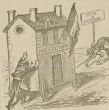
Translation de Montbrison à Saint-Etienne de l'hôtel de la préfecture du département de la Loire.

— Quatre sous la location d'un volume!... merci! j'aime mieux me faire mettre en prison, je lirai tous les romans d'Alexandre Dumas gratis.