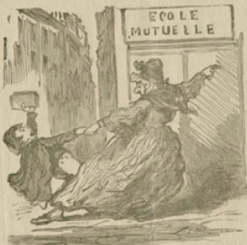
UN JEUNE CITOYEN QUI EST DANS SON DROIT.