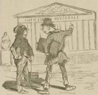
L'OPINION DE POUYOU.