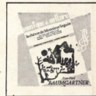
La Chèvre de M. Seguin (Baumgartner) MC - 2505