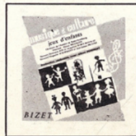
Jeux d'enfants (Bizet) MC - 2503