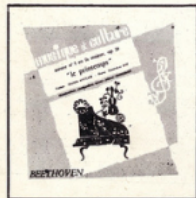
Sonate du Printemps (Beethoven) MC - 3003