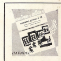
Concerto Grosso (Haendel) MC - 2504