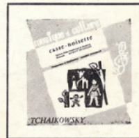
Casse-Noisette (Tchaïkovsky) MC - 2501