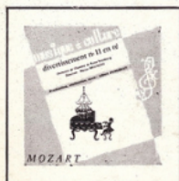
Divertissement en ré (Mozart) MC - 2502