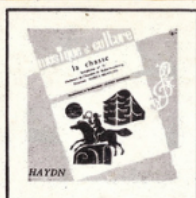
La Chasse (Haydn) MC - 3001