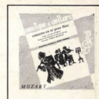
Concerto pour flûte (Mozart) MC - 3002