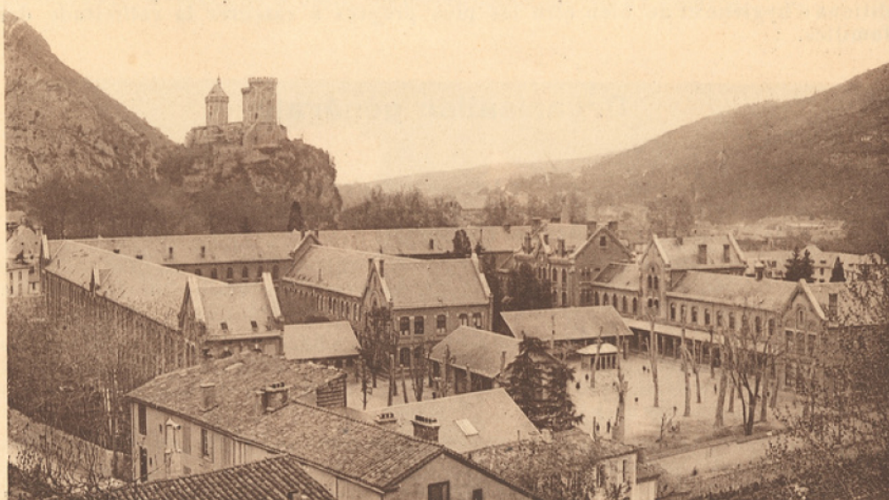
Les Tours et le Lycée