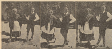
Détails du pas

Quatrième figure : comme deuxième. La fille finit en B, le garçon en D.