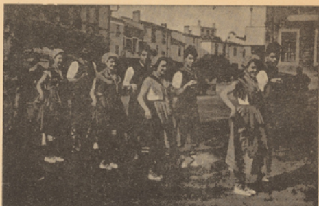
Danseurs du groupe folklorique du Boulou (P.-O.)