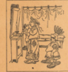
Crispi mettez sa couronne de roi Vignette de Don Quichotte .