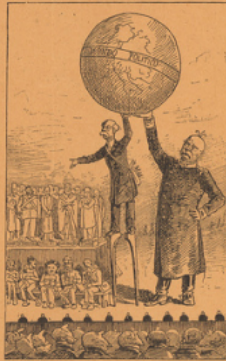
CRISPI AIDANT BISMARCK À SOUTENIR LE MONDE Reproduction d'une caricature italienne du Fischio