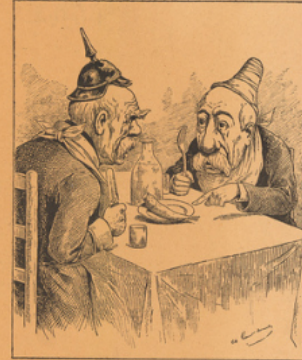
APRÈS LES JOURS GRAS Reproduction d'une caricature de Gilbert-Martin, dans le Don Quichotte .

Ce nouveau volume, de l'auteur des grands ouvrages sur les Mœurs et la Caricature, est, en quelque sorte, une suite au Bismarck raconté par l'Image qui obtint l'année dernière, un succès si considérable. C'est le second volume d'une grande collection qui doit faire défiler sous les yeux du public toutes les figures historiques du passé et du présent.