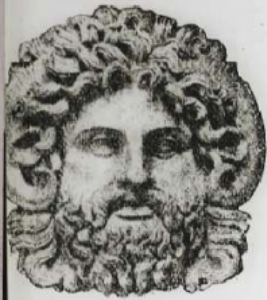
Tête de Jupiter Ammon. d'après une sculpture antique.