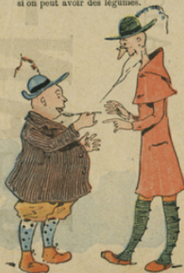
Baliveau déclare à Grandin n'avoir jamais goûté pareil bouillon.