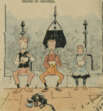
Et les enfants, heureux d'apaiser leur faim, mangent avec appétit la fameuse soupe aux cailloux.