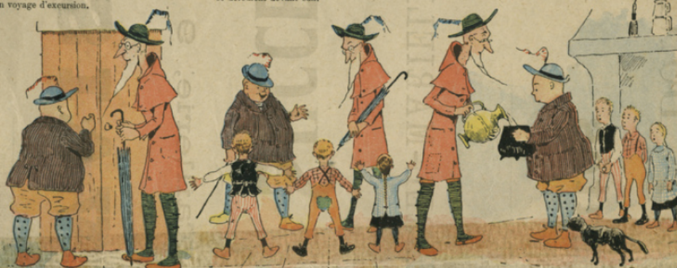
Ils frappent à une chaumière. Ils n'y trouvent que des enfants qui ont faim aussi. Que faire en l'absence des parents ?