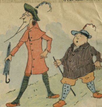
Le grand air et la marche ont croulé l'estomac. Les voyageurs se mettent en quête d'une auberge.