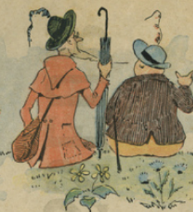
Ils contemplent longuement les sites qui se déroulent devant eux.