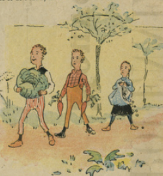
Les enfants ont bientôt fait d'apporter choux et carottes.