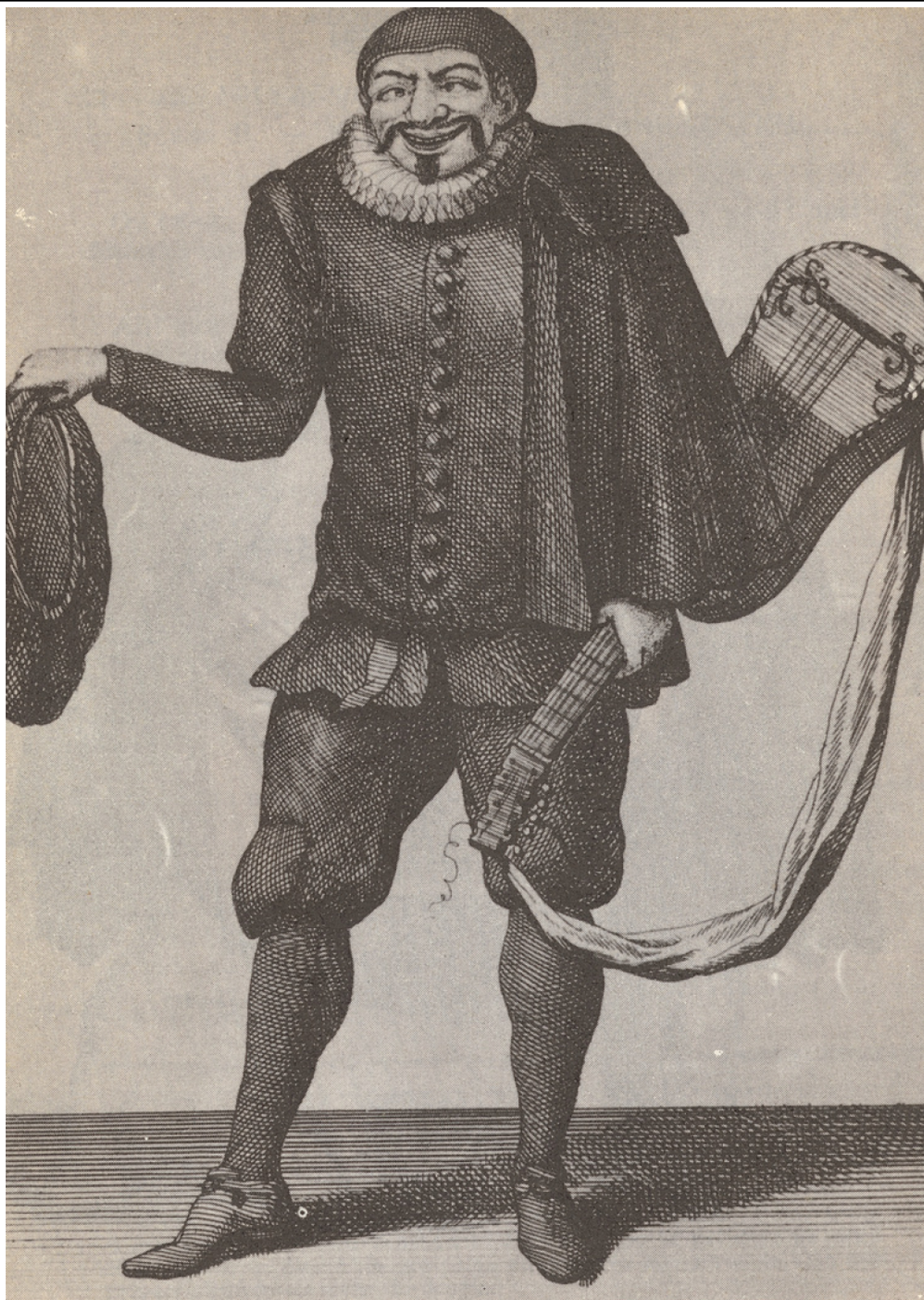
Gravure de Bonnart (xvii e siècle).