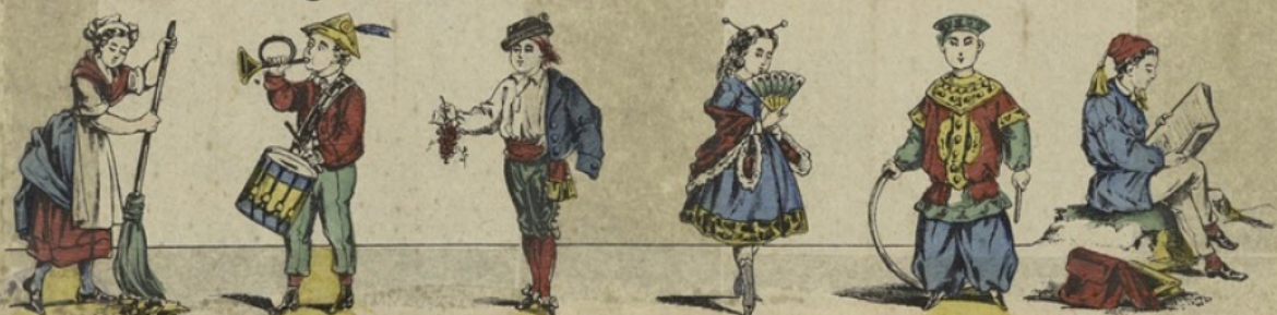
U Utilité. V Virtuose, X Xérésiens. Y Yakonikoui. Z Zèle au travail.