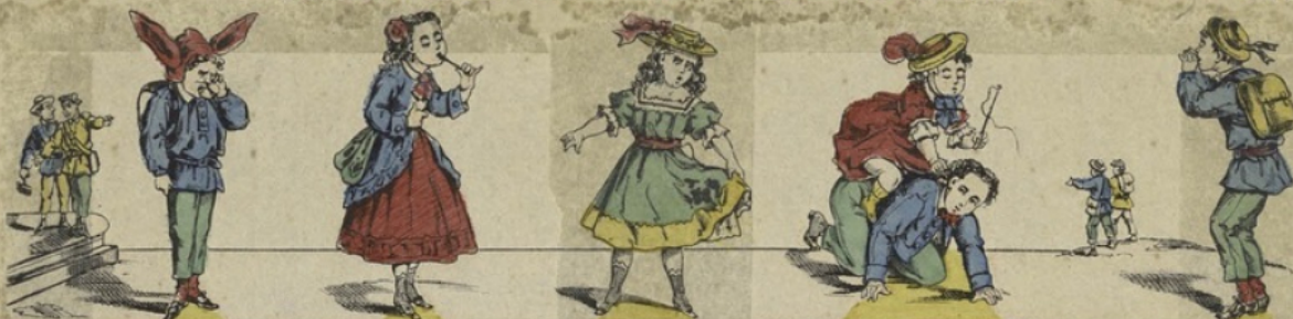
A Le bonnet d'âne. B Bonbon. Que c'est bon C Caca. Fi! caca. D Dada. Hu, dada. E Eh! les autres, ho hé.