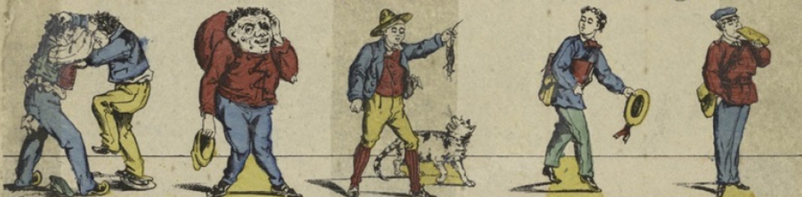
P Polissons. Q Quasimodo. R Rat. Psit! psit! psit! S Salutation. T Tartine.