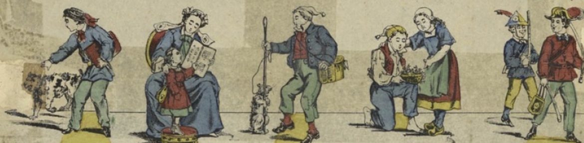
K Kiss, kiss, kiss? L La leçon. M Marmotte en vie! N Nid d'oiseaux. O Officier. En avant, marche!