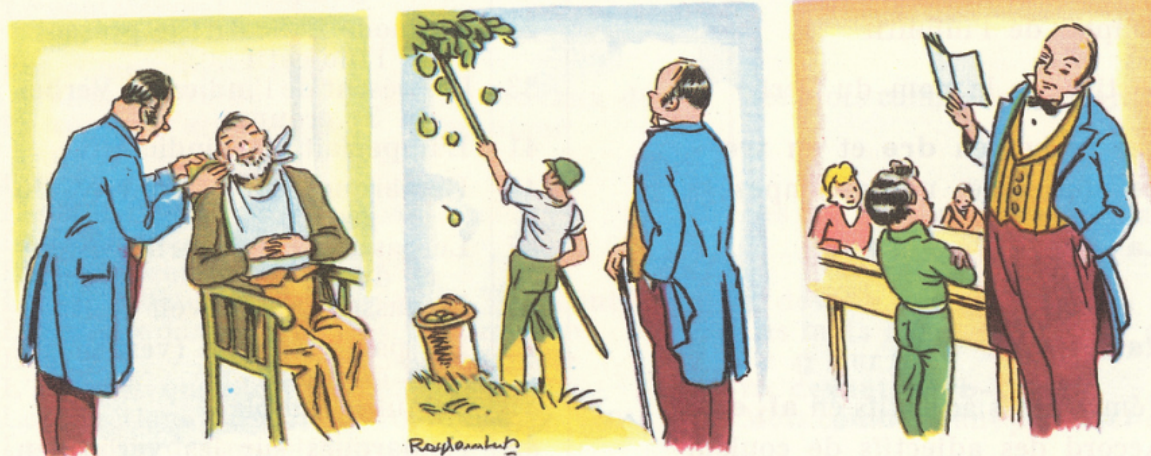
Un instituteur d'autrefois.