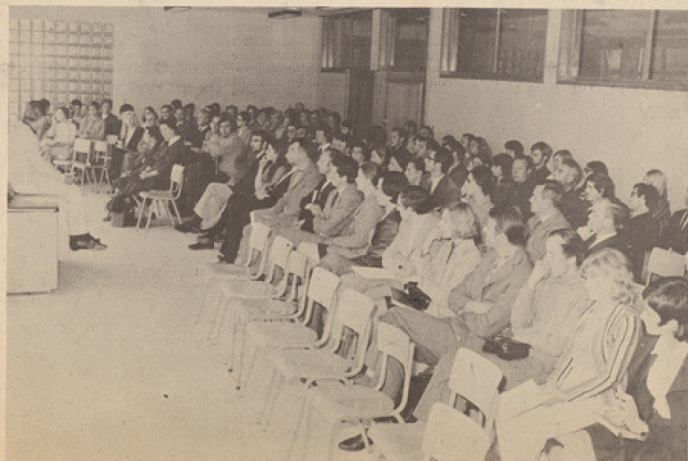
Les enseignants participant aux journées pédagogiques à Stavelot.

Et déjà, dans les premiers échanges de vues qui suivaient ces propos introductifs s'affirmait l'évidente volonté de l'assemblée de faire, dans le meilleur esprit, de l'excellent travail.