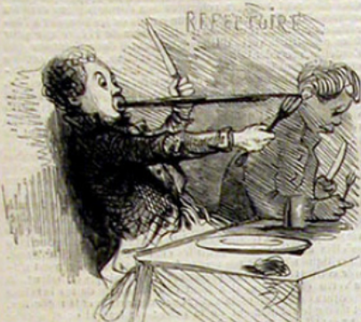
« Une nourriture saine et abondante. » — Extrait du prospectus.