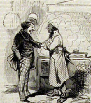
Si le poison est cher, il ne faut pas en acheter; je vais les flanquer tous au pain sec.