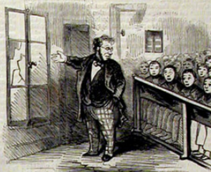
Eh bien, messieurs! puisque je ne puis savoir qui a cassé le carreau, chaque élève en payera un, et si jamais pareille chose se renouvelait, chaque élève en payera deux.