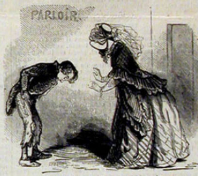
Est-ce possible, grand Dieu! c'est là le pantalon que je t'ai acheté dimanche.