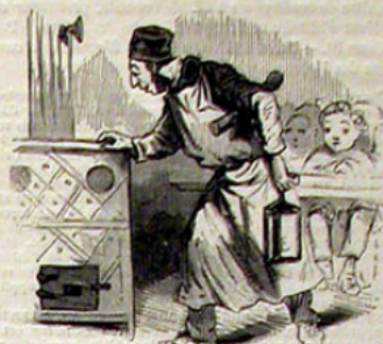
La ration de bois pour toute la journée.