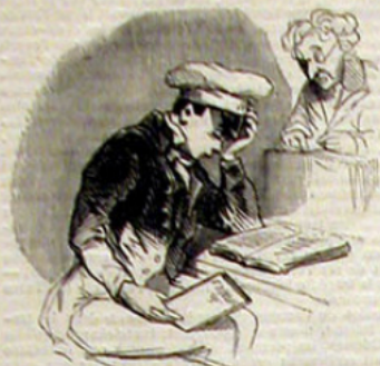
La seconde vue.