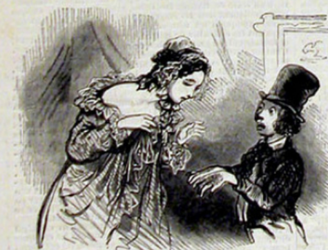
— Mais, maman, je vous assure que je les ai lavés il y a cinq jours.