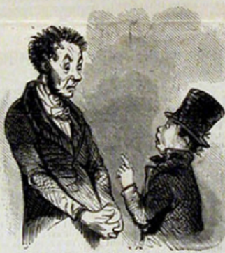
— Eh quoi! encore deux jours de congé! — Oui, papa. Ça ne fait que douze dans le mois.