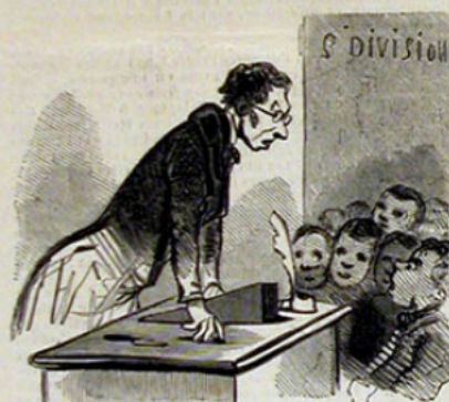
Messieurs, c'est dans quinze jours la fête de votre maître. — C'est cinq francs.