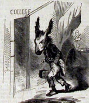
Entrée au collège.