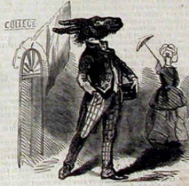
Sortie du collège.