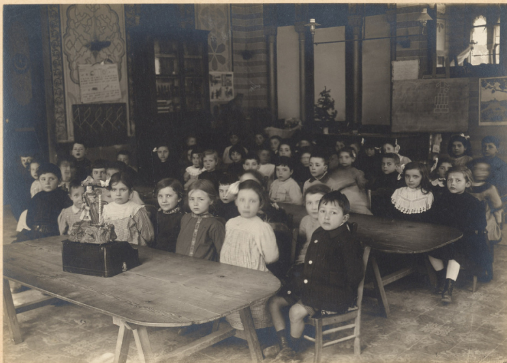
"Jardin d'enfants" Avenue Aubert 25 Nice