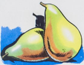
les poi res