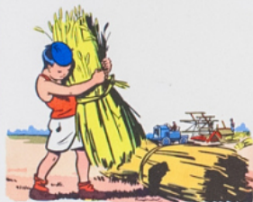
la moi sson